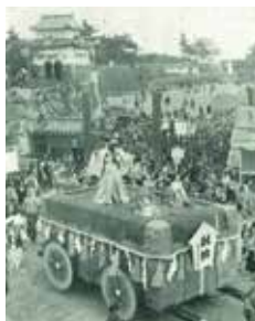
所蔵資料「第1回名古屋まつり 英傑行列」